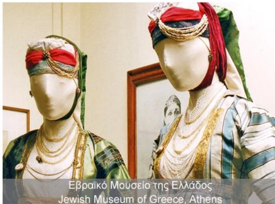
Εβραϊκό Μουσείο της Ελλάδος Jewish Museum of Greece, Athens

Judaica Europeana is one of a series of initiatives supported by the European Commission's eContentplus programme that harvest and aggregate content for EUROPEANA, the European digital library. Europeana draws on rich content from libraries, archives and museums. A prototype can be accessed on www.europeana.eu . A fully operational version will become available later in 2010.